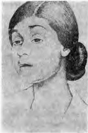
Portrait de Diego RIVERA