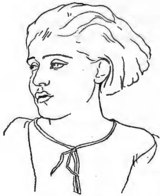
Dessin de Jean CHARLOT