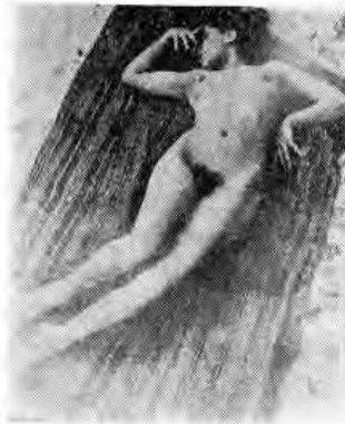
Cl. Ed. WESTON